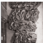
K VIENTO DEL ABISMO Remigio Mendiburu (Hondarribia 1931 – Barcelona 1990)