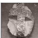
L LA CRUZ DE LA PAZ Eduardo Chillida (San Sebastián 1924 – 2002)