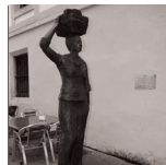
I RECONSTRUCCIÓN Dora Salazar (Altsasu 1963)