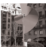
O HOMENAJE AL COREÓGRAFO IZTUETA Néstor Basterretxea (Bermeo 1924 – Hondarribia 2014)